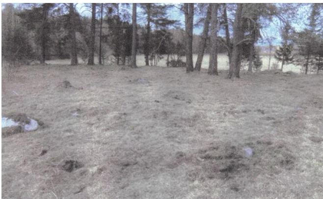
Torpplatsen idag, taget söderifrån. Foto författaren 2012.

Beskrivning: Idag finns en tydlig stengrund, byggd på hållmark, belägen några meter in på Ålsta-sidan. Inga spår efter jordkällare. Enligt Stockholms-Näs hembygdsförenings medlemsblad köptes timret i Nytorp omkring 1918 av soldaten K.E. Vid i Kungsängen att användas vid påbyggnad av det gamla ängsvaktartorpet.