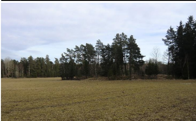
Torpplatsen idag, sedd norrifrån. Foto författaren 2012.