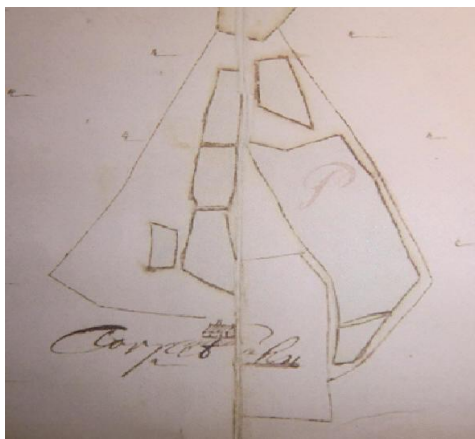
Karta från 1690.

Det sista torphuset på platsen, en knuttimrad parstuga, brann ner i början av 2000-talet. Torpgrunden är utplanad. Det kvarvarande förfallna uthuset är nedbrunnet.