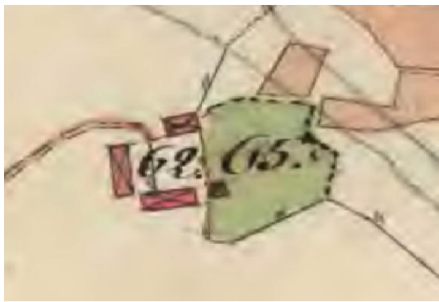
Karta 1802. 62 är hustomt och 65 en åkerlinda.