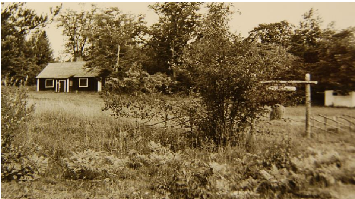
Torpplatsen på 1970-talet.

Torpplatsen Ön är belägen mitt på Norra Ståksön. Platsen är känd sedan mitten av 1600-talet. 1663 omtalas den som "nybygget Strömstorp". Några årtionden senare kallas den Ön eller Öhn som man skrev då. Själva torphuset kallades ibland för Östugan. Till torpet hörde närliggande åkrar, och längre bort låg kärmarken som användes som äng. Hit tog man sig ursprungligen på stigen från Almarestäkets herrgård vilken korsade stora landsvägen där f d restaurangen Dalkarlsbacken nu ligger.