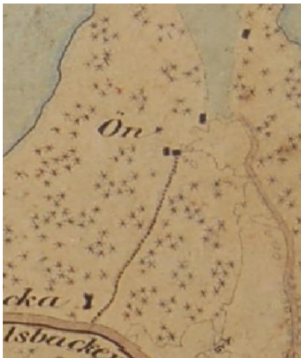
Karta från 1860-talet, innan järnvägen kom. Norr om torpplatsen syns två byggnader vid ängskanten, kanske lador tillhörande herrgården.