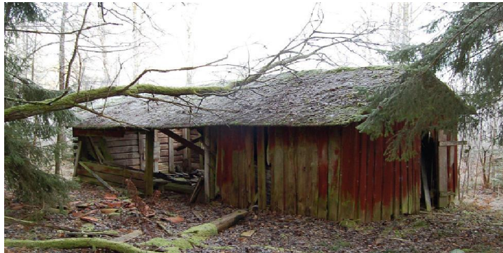
Det sista uthuset (dec 2009). I början av 1900-talet höll torparen två kor, en gris samt smådjur. Huset mäter 9,3 x 4,2 m. Fädelen uppförd i timmer. El har varit framdragen. Nedbrunnet.