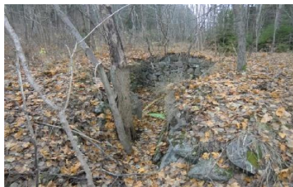
Jordkällaren idag (nov 2011).