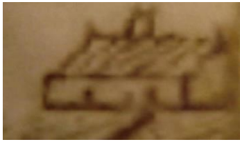
Torpstugan enligt 1690 års karta.