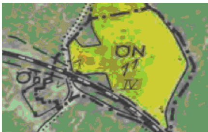
Ekonomiska kartan 1952. Järnvägen löper över den gamla torpplatsen