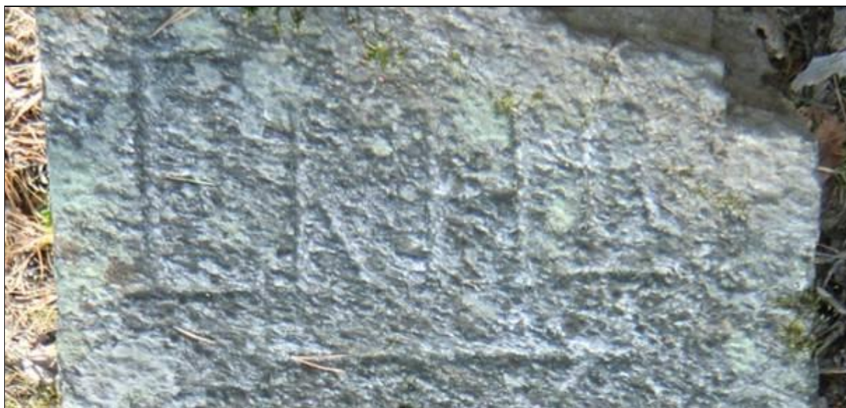
Närbild av texten "EKHR" och pilen under som pekar åt höger.