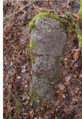
Gamla landsvägen vid Aspvik. Text: "ÖRÅKER, 1/2:M, 290 3/4 F". Fulllängd 143 cm. Uppgifterna på stenen bekräftas av 1864 års vägdelningslängd så stenen är antagligen rest då. Står på ursprunglig plats. Har delvis legat nermyllad, men avses resas av kommunen. (Raä Kungsängen 179:2).