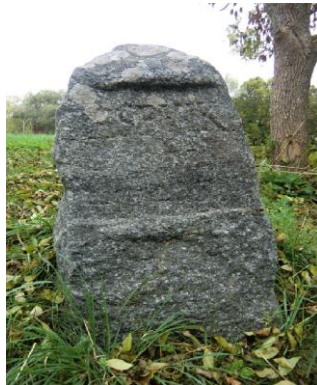
Ekhammars gård. Text: "ASPVİK, 3 M, 1742 F". Höjd 80 cm. Uppgifterna på stenen bekräftas av 1864 års vägdelningslängd så stenen är antagligen rest då. Den stod ursprungligen vid häradsvägen vid Ekhammars gård, förmodligen på nuvarande plats. (Raä Kungsängen 95:2).