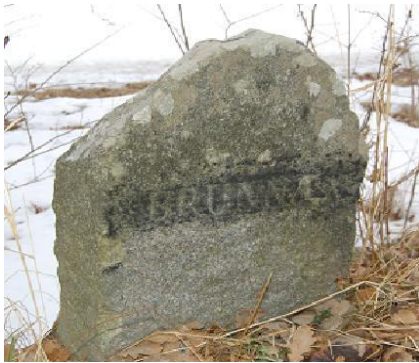
Ekhammars gård. Text: "BRUNNA". Höjd 60 cm. Hitflyttad från okänd plats. (Raä Kungsängen 95:1).