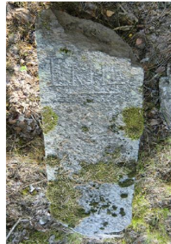
Nära Dalkarlsbackens f d restaurang. Text: "EKHR" (Ekhammar) samt en pil. Längd 145 cm. (Anmäld till fornminnesregistret av undertecknad och fick beteckningen Raä Kungsängen 231).