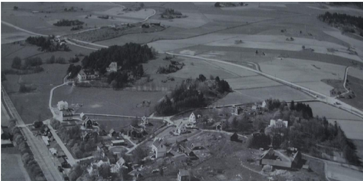
På detta foto från 1936 syns den nyanlagda Enköpingsvägen. Från höger kan skönjas den äldre vägen vid Norrgrind, "födkroken" och Skällsta bro. Hitom ses järnvägsstationen med det dåvarande kringliggande samhället.

Landsvägssträckan mellan Ekboda och Jursta genomgick inga större förändringar under 1700- eller 1800-talen. I början av 1930-talet rätades vägen mellan Ekboda och Jursta och körbanan breddades till 7 m. Då försvann också krokarna på vägen. Med början 1937 stensattes vägen.