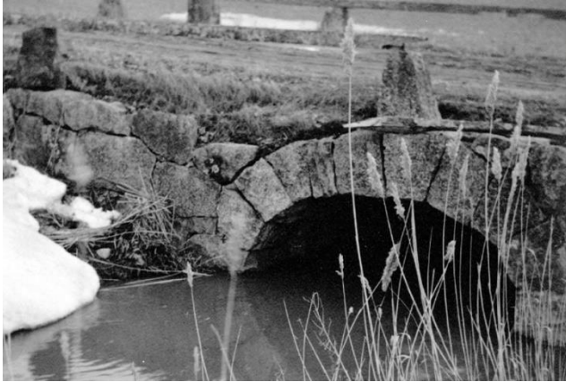
Skällsta stenvalvbro, omnämnd redan 1754. Den ersattes under 1930-talet med en betongbro bredvid när Enköpingsvägen rätades. Ena sidan av bron är riven. Bron är fornminne med beteckningen RAÅ Bro 19:1.

1600-talsvägen passerade således inte sockenkyrkan i Bro, som tidigare varit bygdens centrum och hyste sockenstuga och häradets tingsplats. När kyrkan uppfördes på 1100-talet var vattenvägarna de dominerande kommunikationslederna. Föregångaren till stora landsvägen är troligen en kombination av färdvägar över vatten och till lands. Etablerandet av Stora landsvägen som "förbifart" bör ha skett tidigt och dikterats av behovet av en snabb transportväg mellan Stockholm och Bergslagen.