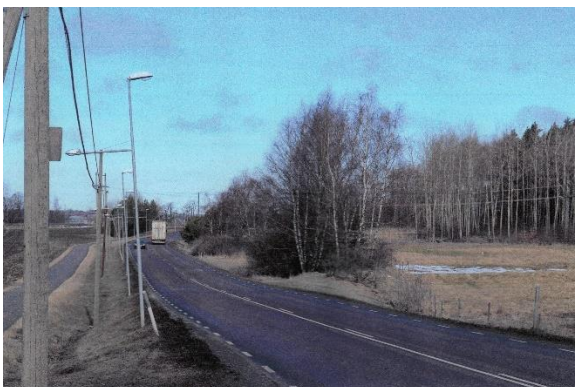
Till höger syns en mindre väl bevarad snutt av 1600-talsvägen, 400 m nordväst om Prästtorp. Den har en bredd om 6 m och vägbanken är några dm hög. Foto författaren 2013.