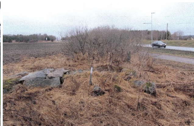
Vid f d sockengränsen mellan Näs och Bro på fältet nedanför Prästtorp finns ännu kvar en snutt av 1600-talsvägen samt rester av en dikestrumma i sten från tiden innan grundvattennivån på fältet sänktes.