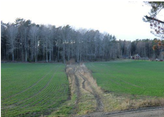
Från Snyggboda-hållet korsas åkermarken av en väg mot Lagmansboda. Vägen har troligen ingått i det äldre stigsystem som före anläggandet av 1600-talsvägen rundade nuvarande Aspviks koloniområde.

Vägsträckan har sedan 1600-talet inte genomgått några större förändringar. Under åren 1926-28 (arbetet drog ut på tiden pga att arbetarna strejkade) gjordes en omläggning, rätning och breddning till 6 m av sträckan Aspviks kvarn-Ekeboda, följt kring mitten av 1930-talet av ytterligare breddning. Under 1980-talet medförde anläggandet av brandstationen vid Kockbacka en vägomläggning som senare kompletterades med Kockbacka-rondellen.