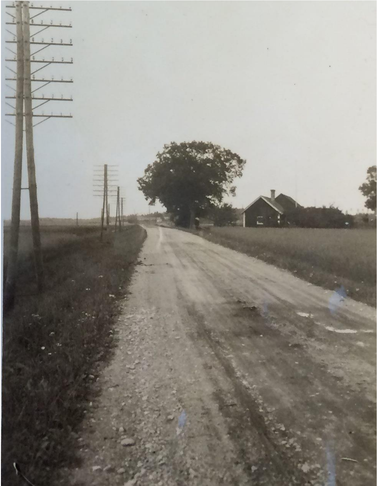
Landsvägen sedd söderifrån mot Ekboda 1924 (strax före Finnsta-rondellen).