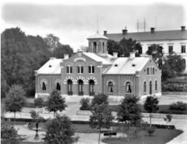
Tingshuset i Enköping, omkring 1905.

I kurvan hade han mött en i stark fart kommande skjuts med två personer. Svarande lyckades bromsa bilen så att den stannade 2 meter från skjutsen som även den stannat. Då skjutsen skulle köra förbi bilen hade åkdonet törnat mot bilens stänkskärm varvid ena hästen blivit skrämmd och kastat åkdonet i diket så att de åkande kastades ur.