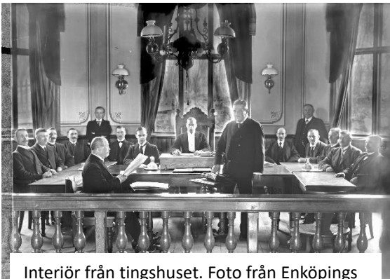
Interiör från tingshuset.