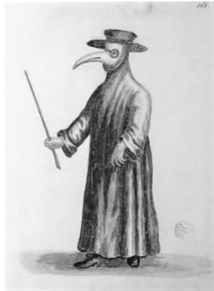
Pestläkare med masken fylld av doftande örter som skulle skydda mot smittsam dålig lukt.

Av stockholmarna dog närmare 22.000 människor, eller 40 %, under ett halvår tills epidemin ebbade ut i januari 1711. För hela landet uppskattas dödstaten till ett par hundratusen människor. Befolkningen uppgick då till ca 1,4 miljoner invånare.