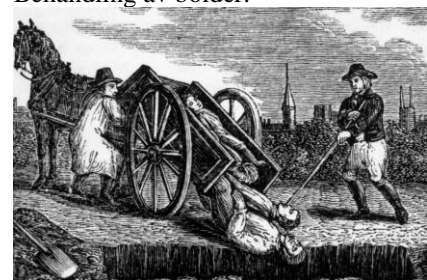
Många som hanterade sjuka och döda, dog själva.

Det började med en skuta från Estland som kom till Stockholm sommaren 1710. Eftersom det var känt att pesten härjade på andra sidan Östersjön gällde sedan något år en karantänstid om 40 dagar, man var alltså helt på det klara om inkubationstiden. Skepparen struntade i karantänen och sökte istället upp en sjökrog. Där föll han plötsligt ihop, stendöd.