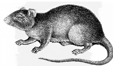
Anses numera oskyldig i just detta fall.

Minnet av den medeltida digerdöden - även kallad svarta döden - som tog livet av var tredje europé, levde säkert kvar. Denna variant av pestsjukdomen var extremt smittsam. Den långa inkubationstiden (en månad) gjorde att de som bar på smittan hann smitta många andra innan de själva insjuknade. De som blev sjuka fick feber och spasmer, smärtsamma bölder över kroppen, mörka fläckar av inre blödningar och ibland angreps även lungorna. Dödligheten var 50-100 %, beroende på vilka organ som angreps. Den pestsmittade plågades svårt och dog inom några få dygn. De som överlevde pinades av spruckna bölder innan sårn läktes. Ny forskning gör gällande att denna medeltida pestsjukdom inte spreds via råttor, som den gängse historiebeteckningen berättar. Istället anses smittan ha överförts från människa till människa via loppor och löss, gynnad av trångboddhet och brister i hygien.