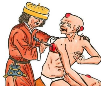
Behandling av bölder.

Loppan suger blod från en pestsjuk människa och överför smittan när den biter en annan människa. Här ses människoloppan Pulex irritans .